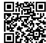
Zum Schaurte GYOD Shop