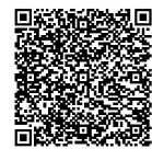
Zum TEAMS iPad Info-Abend

Auch wenn wir uns der Tatsache bewusst sind, dass die Anschaffungskosten bedeutend ausfallen, gilt hierbei, dass je mehr Eltern ein iPad privat anschaffen, desto besser werden wir in Zukunft digital an unserer Schule arbeiten können. Wir bedanken uns für Ihre Solidarität und ihren aktiven Beitrag zur Bildungsgerechtigkeit an unserer Schule, denn durch möglichst viele elternfinanzierte iPads haben wir als Lehrerinnen und Lehrer die Möglichkeit den Kindern ein städtisches iPad auszuleihen, die sich eine Anschaffung momentan nicht leisten können. Für eventuelle Rückfragen stehen wir Ihnen selbstverständlich jederzeit unter den oben genannten Kontaktdaten und am 18.03.2025 zur Verfügung und verbleiben mit den allerbesten Grüßen aus Deutz. Herzlich Ihre